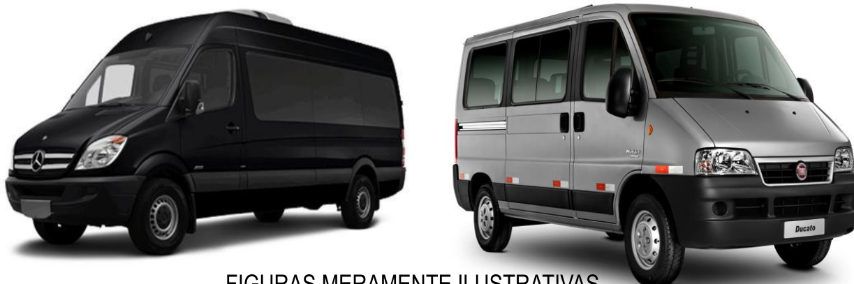
FIGURAS MERAMENTE ILUSTRATIVAS

9.1. Em relação aos serviços pretendidos pela secretaria municipal de saúde, veículos automotores do tipo micro-ônibus ou van com capacidade mínima para 15 (quinze) passageiros, com ar condicionado, assentos estofados e reclináveis, cinto de segurança em todos os assentos, para transportar pessoas carentes encaminhadas para realizarem tratamentos de saúde fora de domicílio conforme rotas estabelecidas no lote I, item dois deste Termo de Referência, conforme datas e horários pactuados entre as partes.