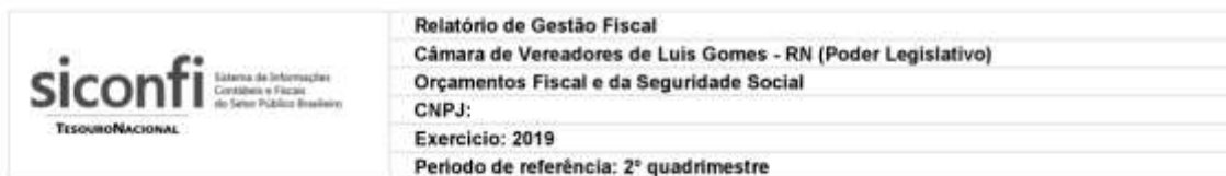
RGF-Anexo 01 | Tabela 1.2 - Trajetória de Retorno ao Limite da Despesa Total com Pessoal