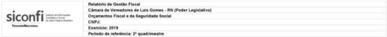
RGF-Anexo 01 | Tabela 1.0 - Demonstrativo da Despesa com Pessoal