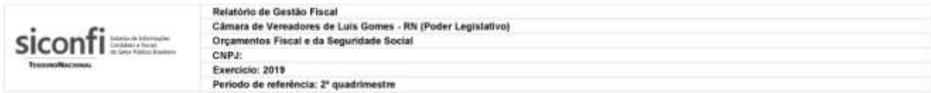
RGF-Anexo 01 | Tabela 1.2 - Trajetória de Retorno ao Limite da Despesa Total com Pessoal