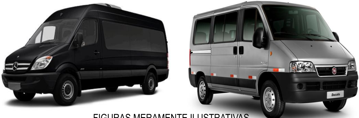
FIGURAS MERAMENTE ILUSTRATIVAS

9.1. Em relação aos serviços pretendidos pela secretaria municipal de saúde, veículos automotores do tipo micro-ônibus ou van com capacidade mínima para 15 (quinze) passageiros, com ar condicionado, assentos estofados e reclináveis, cinto de segurança em todos os assentos, para transportar pessoas carentes encaminhadas para realizarem tratamentos de saúde fora de domicílio conforme rotas estabelecidas no lote I, item dois deste Termo de Referência, conforme datas e horários pactuados entre as partes.