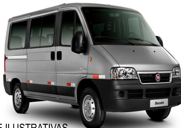
FIGURAS MERAMENTE ILUSTRATIVAS

11.4. Já em relação aos serviços pretendidos pela secretaria municipal de assistência social, trata-se de veículos automotores dos tipos leve, pick-up, para transportar leite do Programa Leite Potigua – PLP do Governo do Estado para várias comunidades rurais do município de Luís Gomes, conforme rotas estabelecidas no item dois do presente Termo de Referência